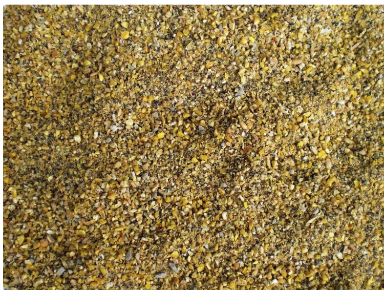
Figur 1. Foderstruktur som anbefalet af Robert Pottgueter.